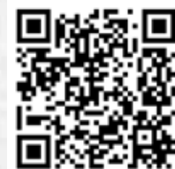
考試範圍 (中國民族管弦樂學會網頁)